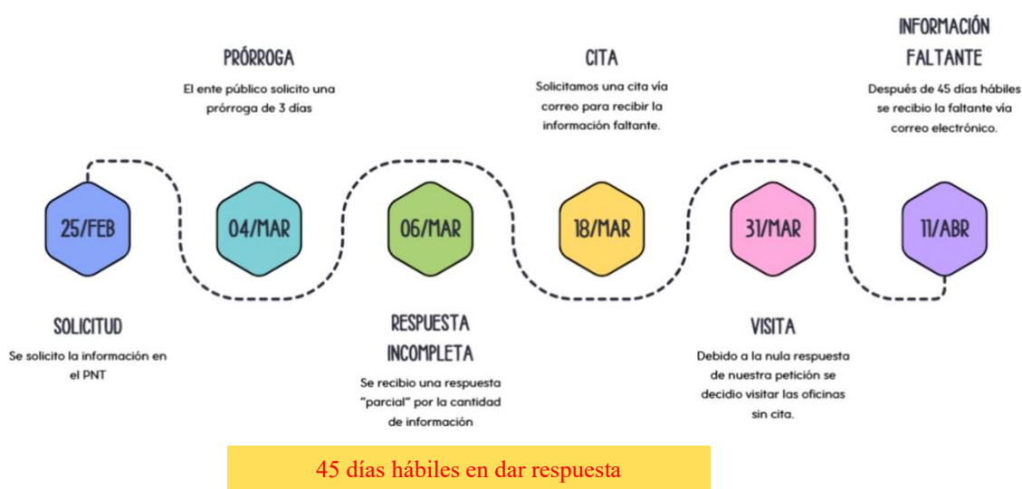
Imagen 2. Tiempo de respuesta edificios A y B oficinas ISSEG

Una vez seleccionada la obra pública que sería objeto de análisis, procedí a formular la solicitud de información en la PNT, con el propósito de contar con documentos que permitieran conocer de manera puntual los procesos de contratación, adjudicación y ejercicio de los recursos públicos destinados a dicha obra. Para tal efecto, integré el requerimiento en apego a lo señalado en el Anexo 1, que establece los criterios e insumos mínimos indispensables para garantizar la suficiencia de la información. El tiempo transcurrido hasta la obtención de la respuesta se detalla en la imagen siguiente: