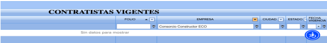
Imagen 4 Estatus del Contratista en el PUC