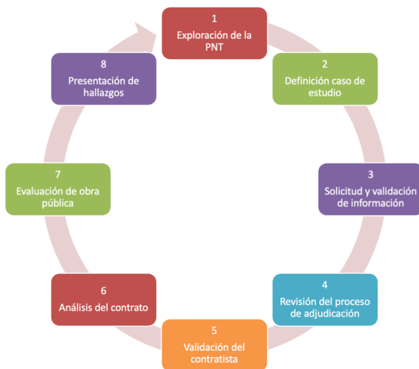
Imagen 1. Etapas de ATRACO

El proceso se desarrolla de manera secuencial a través de ocho etapas, como se muestra en la siguiente imagen.