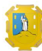
San Luis Potosí