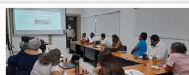
"Ética y marco legal de la administración pública".