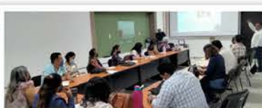
"Planeación estratégica y prospectiva".