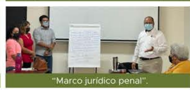
"Marco jurídico penal".