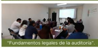
"Fundamentos legales de la auditoría".